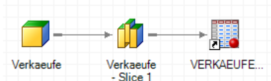
Abbildung 6: Weiterverarbeitung in SAS Enterprise Guide

Wenn mit Daten aus dem Würfel weiter gearbeitet werden soll, kann dies mit der rechten Maustaste und der Auswahl [Segment erstellen] erfolgen: