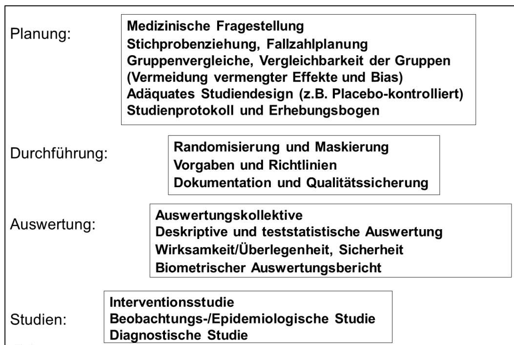
Abbildung 1: Lerninhalte des Vorlesungsmoduls

Der zu vermittelnde Lernstoff der gesamten Vorlesung beinhaltet verschiedene, für die Praxis relevante Komponenten von Planung, Durchführung und Auswertung von Studien (Abbildung 1).